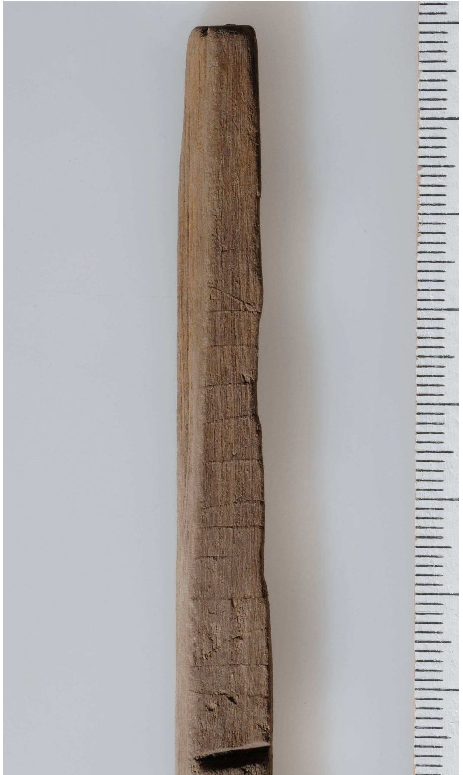
Fig. 3. Detalj av inskriften på sida A. Foto Gabriel Hildebrand/SHM 2011.