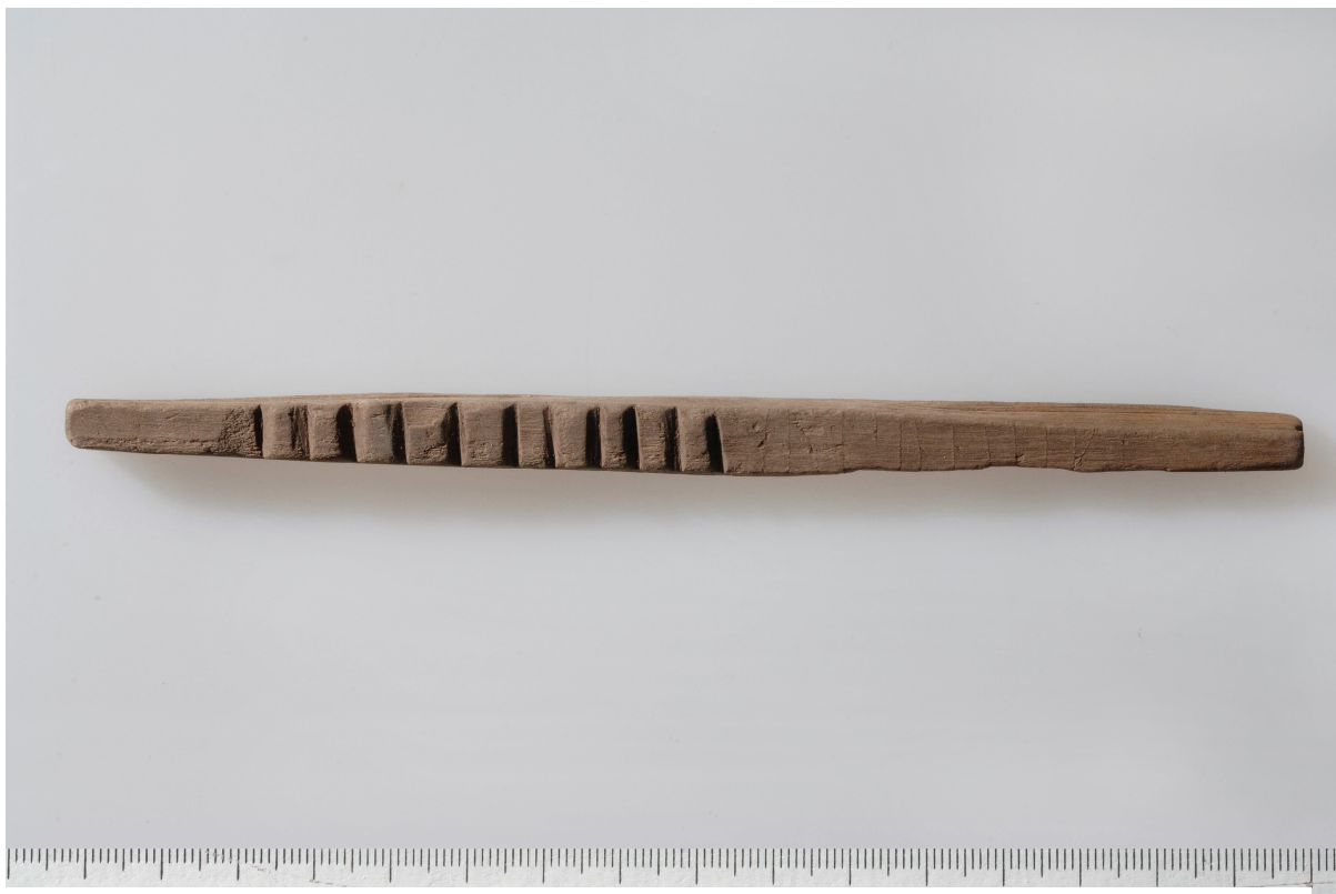
Fig.1. Framsidan (A) av karvstocken från Kv. Traktören 2, Enköping.

skulle vara f utan g . Läsningen f verkar dock troligare. Runa 2 är u med en bågböjd bistav. Huvudstav och bistav är inte riktigt förenade i toppen. Ett par små bortfall finns i träet till vänster om bistaven. Runa 3 utgörs av en bakvänd þ -runa. Den övre delen av bistaven består av en rak linje snett nedåt vänster, vilken sedan övergår i en båge in mot huvudstaven. Mellan runan 3 och 4 finns vid den övre kanten en kort linje snett nedåt vänster. Denna är sannolikt tillfällig och tillhör inte ristningen. Runa 4 består av en 5 mm lång lodrät linje från den övre kanten och halvvägs ned på skriftytan. Ingen avslutande markering finns i den nedre änden. Ett litet bortfall i träet till vänster om mitten av linjen kan knappast uppfattas som en avsiktlig stingning. Runan tolkas enklast som s -runa av kortkvisttyp, men kan givetvis också återge c eller z . Runa 5 består av en rak huvudstav utan bistavar. Strax nedanför mitten och på den vänstra sidan finns ett litet bortfall, som dock inte bör tolkas som en avsiktlig stingning. Runan är alltså i . Runa 6 är n med en ganska lågt ansatt bistav snett nedåt höger. Bistaven sträcker sig rätt långt ned, men når inte fram till den nedre kanten. Runan kan därför knappast tolkas som ett stupat k . Runa 7 är av allt att döma också n , men den ensidiga bistaven har ingen förbindelse med huvudstaven, utan börjar 0,5 mm till höger om denna. Runa 8 består av en rak huvudstav som lutar svagt åt vänster. Runan har inga bistavar