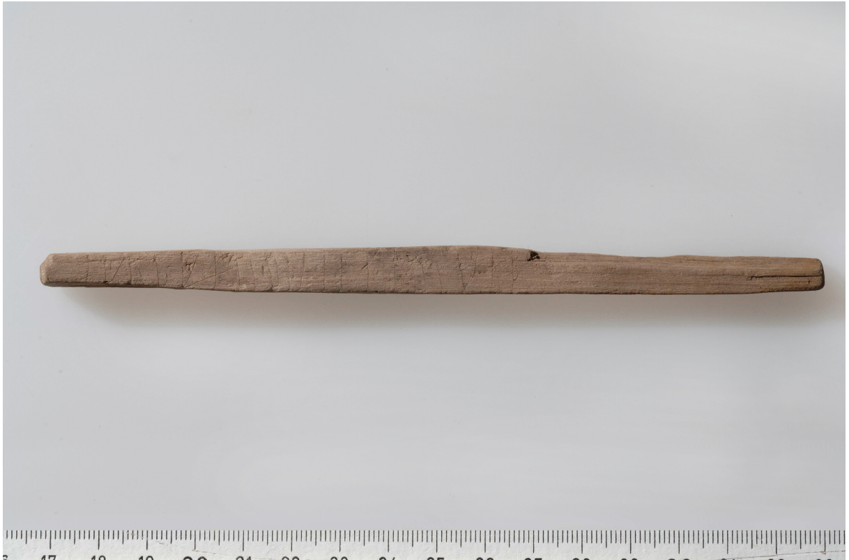
Fig. 2. Baksidan (B) av karvstocken från Kv. Traktören 2, Enköping.

är inte förenad med huvudstaven och tillhör därför snarare den följande runan (runa 10). Runa 10 utgörs av en rak huvudstav som är något skadad i toppen. Om den ovan nämnda bistaven tillhör denna runa bör den läsas som t. Nedtill mellan runa 9 och 10 har ett stycke av ytan fallit ur. Runa 11 är þ med en relativt smal bistav placerad på mitten av huvudstaven. Runa 12 utgörs av en rak huvudstav och skall snarast uppfattas som i. På mitten till höger om huvudstaven finns en kort, ganska svag och något böjd linje, som möjligen kan vara avsedd som en stingning och tyda på att runan skall läsas som e. Den följande runan (13) saknar bistavar och är följaktligen i. Huvudstaven når inte upp till den övre kanten. Runa 14 är skadad i toppen. Runan har en ensidig bistav snett nedåt höger och är alltså n. 15 a har ensidig bistav. Runa 16 är t med ensidig bistav till vänster, som utgår från den övre kanten, 0,5 mm till vänster om huvudstavens topp. Runa 17 utgörs av ett smalt u, där bistaven utgår nedanför toppen i runan. Runan kan inte läsas som r. Runa 18 utgörs av en rak huvudstav utan bistavar och är alltså i. Även runa 19 utgörs av en rak huvudstav, som trots en ytskada på mitten kan följas i hela sin längd. Till vänster om den övre delen av staven finns en trekantig skada, där den vänstra kanten är jämn och möjligen kan utgöra resterna av en bistav snett uppåt vänster. Det är dock mycket tveksamt om detta är rester av ristning. Strax till