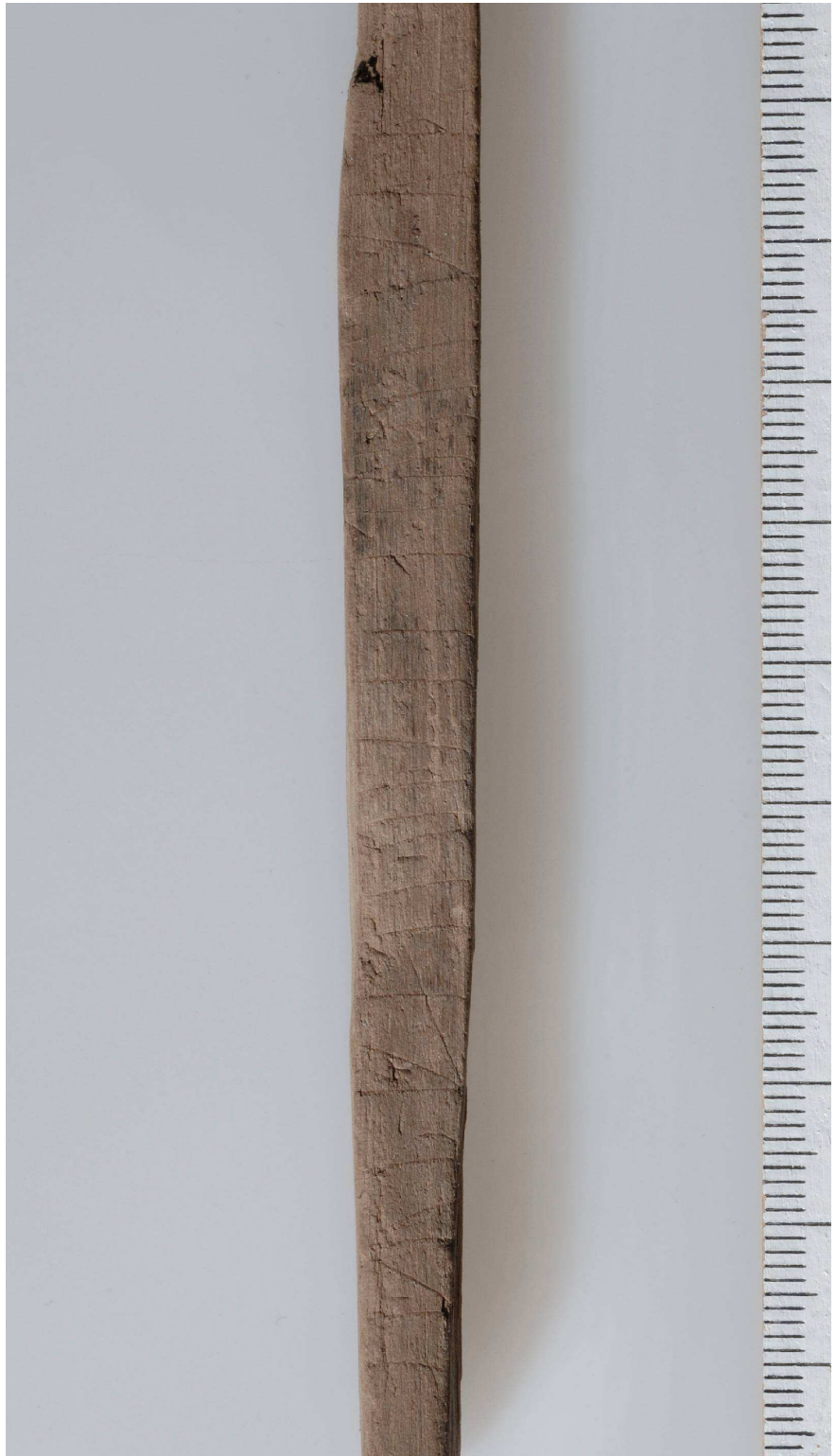
Fig. 4. Detalj av inskriften på sida B.